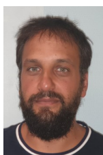
Responsable 1er degré

Les Assistants d'Éducation n'assurent pas de fonctions d'éducation. De ce fait, les FSE, ayant exercé cette fonction avant la réussite du CRPE, peuvent entreprendre un reclassement sans prendre le risque de ne pas percevoir la prime d'entrée dans le métier. C'est également le cas des collègues FSE ayant été Emploi Avenir Professeur.