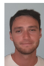
Responsable Entrée dans le métier