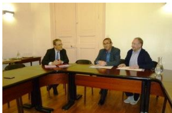
Rencontre avec Patrick Bloche candidat PS à la 6 e circonscription de Paris

Pour l'UNSA Retraités, la dignité de toute personne, quel que soit son âge ou son état de santé, doit être respectée en toutes circonstances.