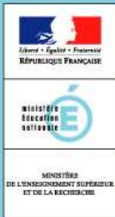
Schéma d'emplois 2011 - 2013