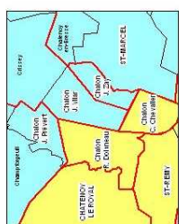
Répartition des secteurs de collèges de Chalon entre Chalon I et II