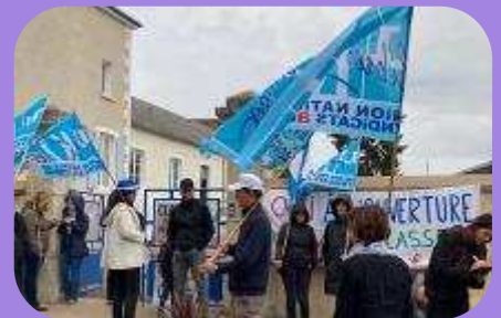
Manifestation à Tracy

Toute l'équipe et les élèves vous disent un grand merci pour votre aide et votre soutien !