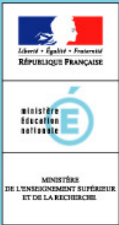
Schéma d'emplois 2011 - 2013