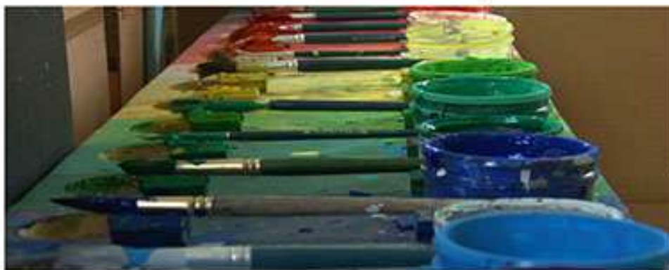
image et son Mathilde Syre - montage Cécile Boutain - mixage Bertrand Neyret produit par l'association Achromat

Présence exceptionnelle de la réalisatrice !