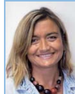
Dany Le Damany Jeunes Enseignants Santé Secteur EST